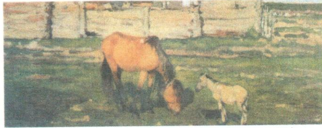
Рыбинский историко-архитектурный и художественный музей-заповедник