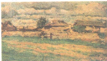
Ил.1 Облака (Домики). 1914 Екатеринбургская картинная галерея

Исследуемое произведение выполнено Л.Туржанским а la prima. Мотив сельского пейзажа характерен для натуральных этюдов художника, выполненных им на Урале, в местечке Малый Исток, где находилась его мастерская. Экспертируемое произведение создано свободными и темпераментными мазками, что характерно для живописной манеры мастера 1910-х годов. Типичен и колорит произведения, построенный на сочетании охристых, зеленых и коричневых тонов. Все это находит аналогии в известных картинах Л.Туржанского, таких как: «Облака (Домики)» 1914 (Ил.1), «На солнце» 1913 (Ил.2).