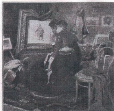
189. СИМОВЪ, Мечты (52x53). СИМОВ, РЕЛИС.