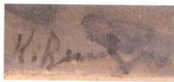
И слева проставленная автором дата