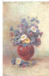
Ромашки и васильки. ЧС