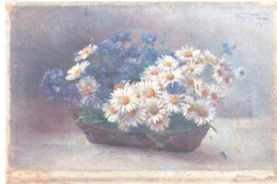
Корзина полевых цветов. х/к.м. 40x60,1. ЧС