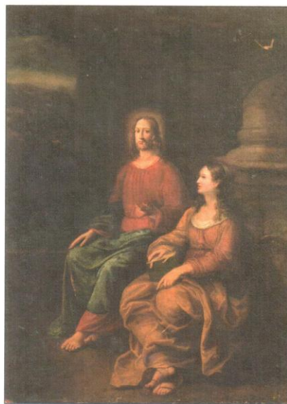
Протокол экспертного совета № 11 от 26 марта 2020 года