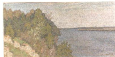
Вид на реку. 1910-е К., м., 34,3x71,2. ЧС