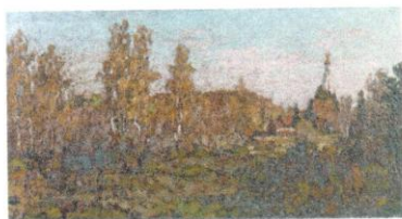
Осень. 1904. Х., м., 98 x 187. Национальная галерея Республики Коми, Сыктывкар

В экспертируемой картине налицо художественные приемы, свойственные творческой манере П.И. Петровичева: многослойная живопись, цветовая палитра, стремление к обобщениям живописных форм, а также особое внимание к силуэту. Фактура его произведений отличается плотностью красочного слоя, которая часто напоминает декоративный рельеф, что характерно и для экспертируемой работы. Горизонтальная композиция с панорамным видом на поле или реку также характерна для пейзажей