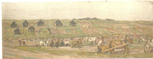
Пашня. 1908. К., м., 20,9x55,6. ЧС