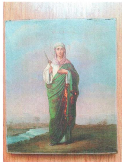
Илл.1. Мц. Антонина. 1878 г.

На иконе мц. Антонины 1878 г. из частного собрания (илл.1) мы видим близкий колорит в одеждах и водоем на поземе, что подтверждает наше предположение о том, что на исследуемой иконе изображена Антонина Никейская.