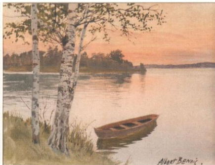
примера см. ил.3 2 «Берег