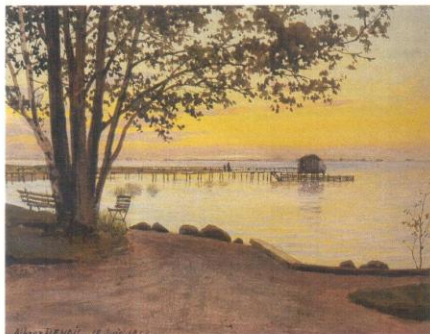
годов, ил.2 качестве

Сравнение данной работы с эталонными образцами графики А.Н.Бенуа из музейных и частных собраний выявило несомненное сходство в характере авторского мазка, способах построения объёмов и пространства, колористическом и композиционном решении. Наибольшее количество аналогий наблюдается с акварелями 1900-1910-х