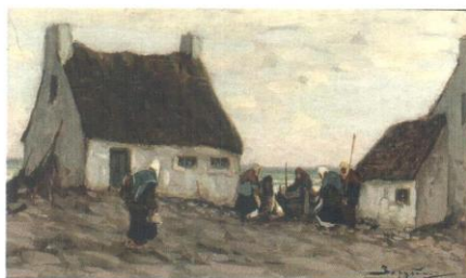
Северный пейзаж. Гуашь, картон. 9x15 (в свету). Музей Республики Карелия