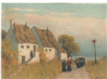
В Бретани. 1910. К., м. 34,4x47,8. ЧС