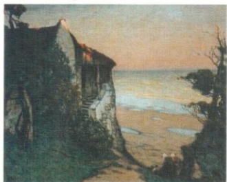
Дом у моря. Бретань. 1916 Сочинский художественный музей

Мотив исследуемой композиции с изображением нормандок характерен для творчества художника. В 1910-е – 1920-е годы Зарубин создавал картины, в которых использовал сюжеты и стилистику своих более ранних произведений нормандского цикла. Данные картины активно публиковали популярные иллюстрированные журналы, такие как Нива, Новое время, Север, Огонек и другие. Исследуемая работа «Летний день» изображает сцену из жизни в северной Франции (с 1893 по 1896 Зарубин учился во Франции) с характерными для нее архитектурой и фигурами людей. Типичны для художника декоративная стилизация форм и линий. Характерны композиция и колорит произведения,