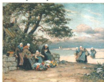
Цветочницы. Нормандия. 1924. Х., к., м. 38,5x50,3. ЧС