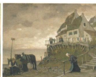
Нормандия. На берегу. 1919. Ф., м. 73x91. ГРМ. Ж-11924

построенный на сочетаниях голубых, розовых, зеленоватых и умбристых цветов, что находит аналогии в других работах В.Зарубина (см.ил.).