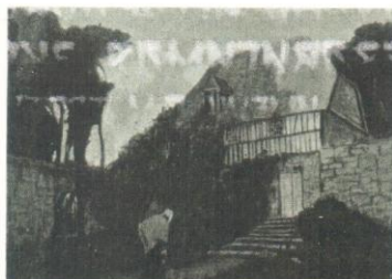
В. Зарубин. Старый дом. Ива. №16. 1911. с.309