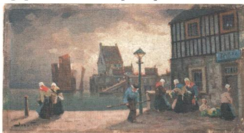
Вечер в Нормандии. 1922. Х. на к., м. 22,7x41. ЧС