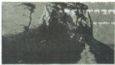
В. Зарубин. Порыв ветра (5-я серия). Ива. №26. 1910. с.464