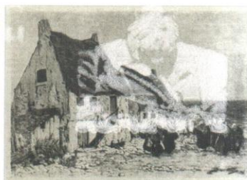
Новое время. 5(18).11.1911. с.5